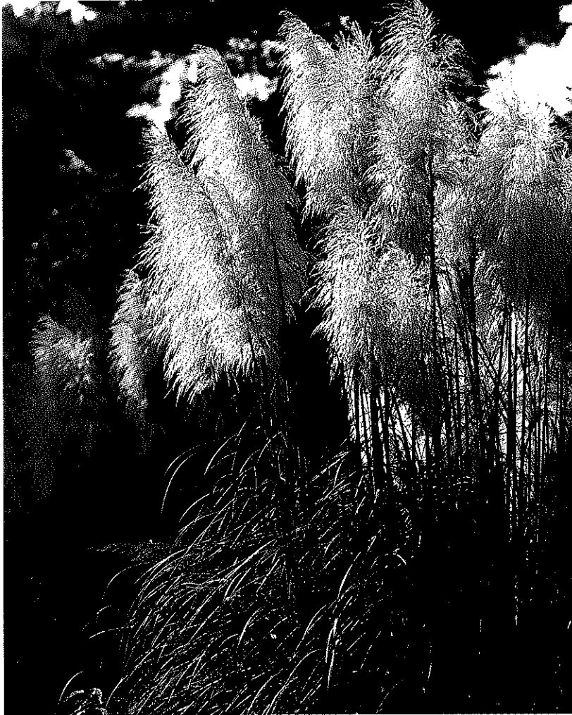
銀葦 (しろがねよし)