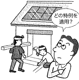
図表1 税額控除の種類

個人が、住宅の新築や購入又は増改築等を行った場合、一定の要件を満たす時には、五種類ある税額控除のいずれかを適用することによって、居住の用に供した年分以後の各年分の所得税額から一定金額を控除することができま ただし、どの税額控除を適用するか判断が難しいところがありますので、今回、ポイントを整理してみます。